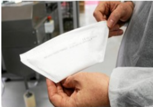
L'usine M3 Sistrade de Ploufragan produit entre 800 000 et 900 000 masques FFP2 par semaine pour répondre à la demande.

Pour répondre au carnet de commandes, des intérimaires sont aussi venus renforcer les équipes en début d'année. Et des heures supplémentaires ont été nécessaires pour tenir la cadence. « Nous avions constitué un peu de stock mais il a fondu en deux jours. Aujourd'hui, les masques produits partent quasiment aussitôt ».