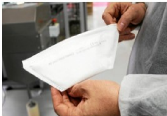
L'usine M3 Sanitrade de Ploufragan produit entre 800 000 et 900 000 masques FFP2 par semaine pour répondre à la demande.