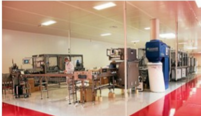
La production de l'usine de masques M3 Sanitrade, à Ploufragan, a doublé depuis le début de l'année.